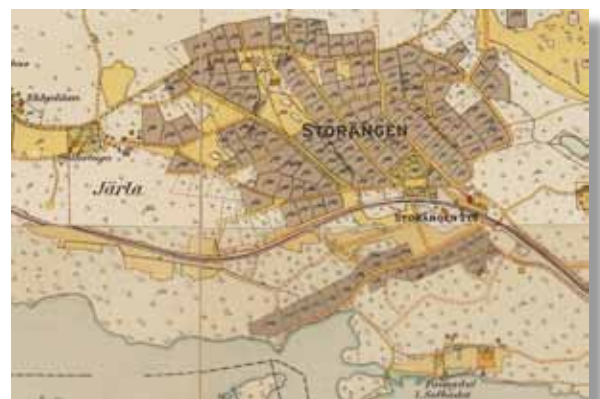
Storängen med omnejd 1917-1934