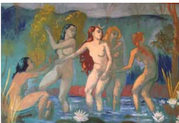
"Diana och nymferna" av Isaak Grünewald

Under visningen av huset kommer ni att få se en hel del detaljer i arkitekturen. Interiören med vacker marmor, svensk och italiensk. Möbler och armaturer som specialbeställdes för lokalernas utformning och förskönande.