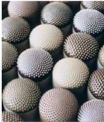
Keramikpluggar i Frösunda