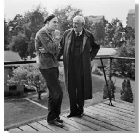
Ingmar Bergman i samtal med Victor Sjöström, 1957

Kommunikation: Blå T-bana mot Akalla, station Näckrosen, uppgång Filmstaden.