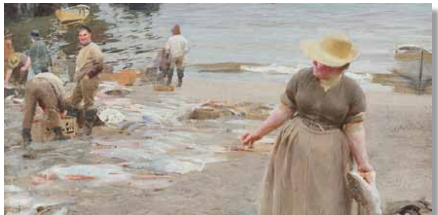
Detalj ur Anders Zorn, "Fiskmarknad i St Ives" 1888

Vi får en privat visning av det bästa som skall säljas på slagauktionen 6-7 december. Visningen pågår ca 1 timme.