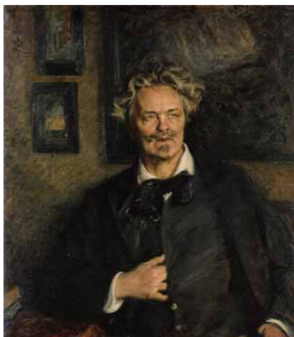
August Strindberg av Richard Bergh, 1905

Bonnierska Porträttsamlingen startades av Karl-Otto Bonnier omkring sekelskiftet. Den växer ständigt och består idag av över 300 verk.